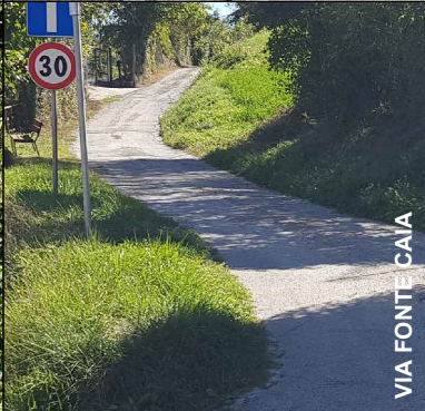
VIA FONTE CAIA