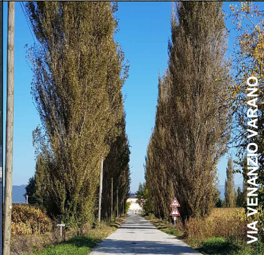
VIA VENANZIO VARANO