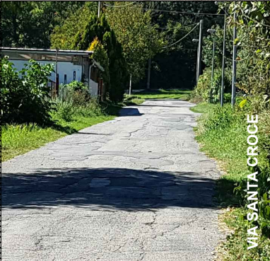
VIA SANTA CROCE