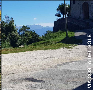
VIA COSTA DEL SOLE