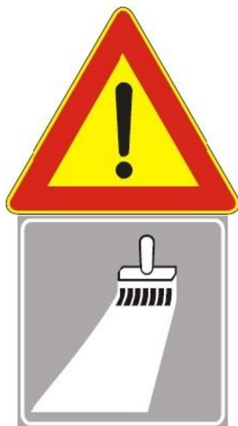
Figura Il 391 Art. 31