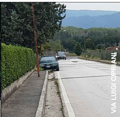
VIA LUIGI CIPRIANI