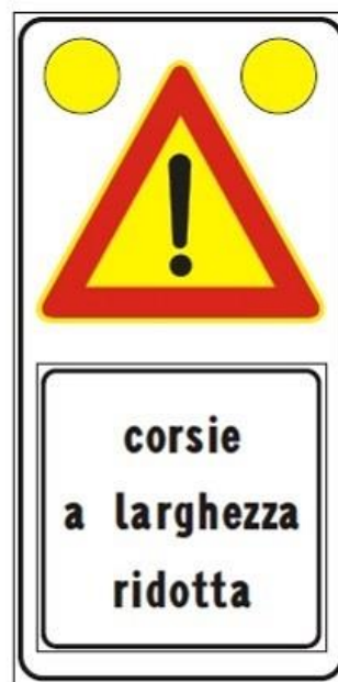
Figura Il 391c Art. 31